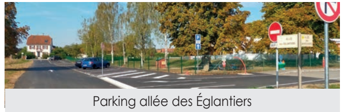
Parking allée des Églantiers

Nous avons réalisé un parking à destination principale du personnel de l'ALSH, Allée des Églantiers, un parking rue des Prés à destination des immeubles voisins afin de désengorger la voie, des abaissements de trottoirs rues du Rhin et du Maréchal Foch, la mise en œuvre de revêtement de trottoir rue de la Liberté, rue Paul Bader, rue de Schlierbach, aux abords de la salle polyvalente, des modifications sur les parkings de l'école Léonard de Vinci et Paul Klee et la réhabilitation de l'îlot, au croisement des rues du Maréchal Foch et de Habsheim.