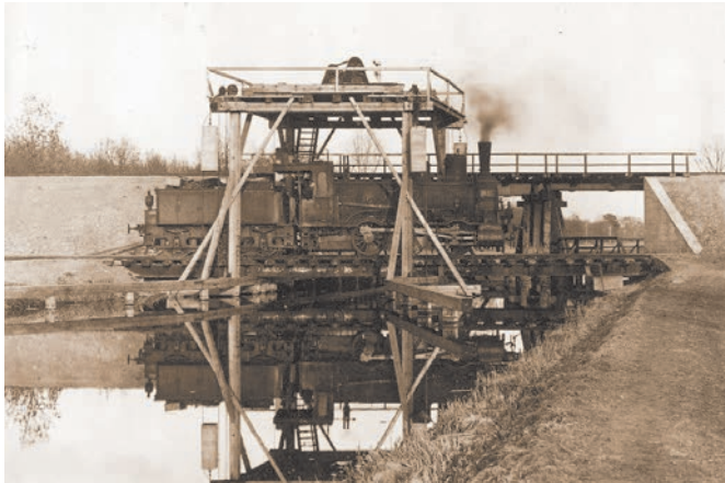
Point de passage du canal du Rhône au Rhin à Niffer - 1918

été construites quasiment sur le ban de la commune, l'une à Kembs, rue du Hêtre, la seconde à Schaeferhof (Loechlé) dans la forêt de la Hardt derrière la rue du Frêne.