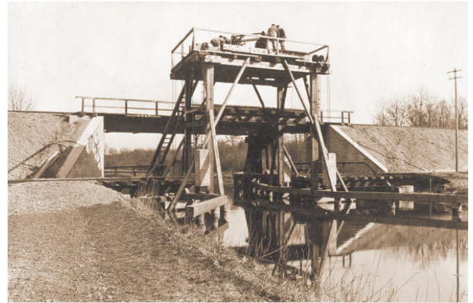
Point de passage du canal du Rhône au Rhin à Niffer - 1918

Malgré des tractations en vue d'une reprise de l'activité, le coût de construction des bâtiments à édifier fit renoncer à ce projet. Déclassée, la ligne fut démantelée en 1928.