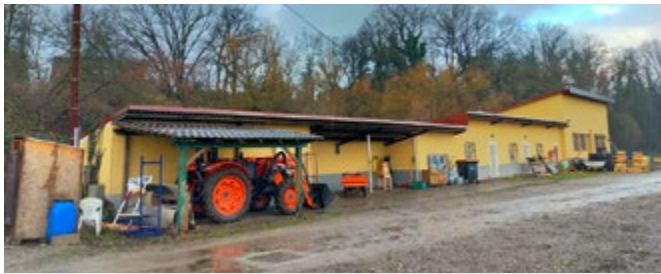
Anciens bâtiments à démolir

Le programme prévoit de démolir les bâtiments existants et de construire un hangar pour l'Archipel qui a pour vocation la pédagogie et notamment, d'accueillir les enfants inscrits au périscolaire et scolarisés dans nos écoles. L'objectif est de fournir un outil de travail au maraîcher pour la production de légumes. Il s'agira également d'enseigner aux enfants la transformation des produits agricoles sur place. Le nouveau bâtiment aura une forme rectangulaire avec une toiture en pente. Les légumes seront acheminés d'un côté, passeront par une opération de lavage, afin d'être mis à disposition des fournisseurs de repas aux enfants et au GASPR. Ils pourront être cuisinés sur place, sous forme de conserves, confitures ou de plats lors d'ateliers pédagogiques. Les travaux vont commencer en mars par la démolition des locaux existants, pour se terminer fin d'année.