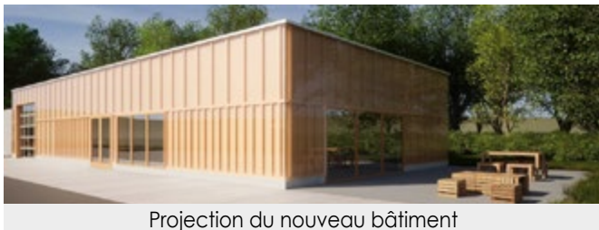
Projection du nouveau bâtiment